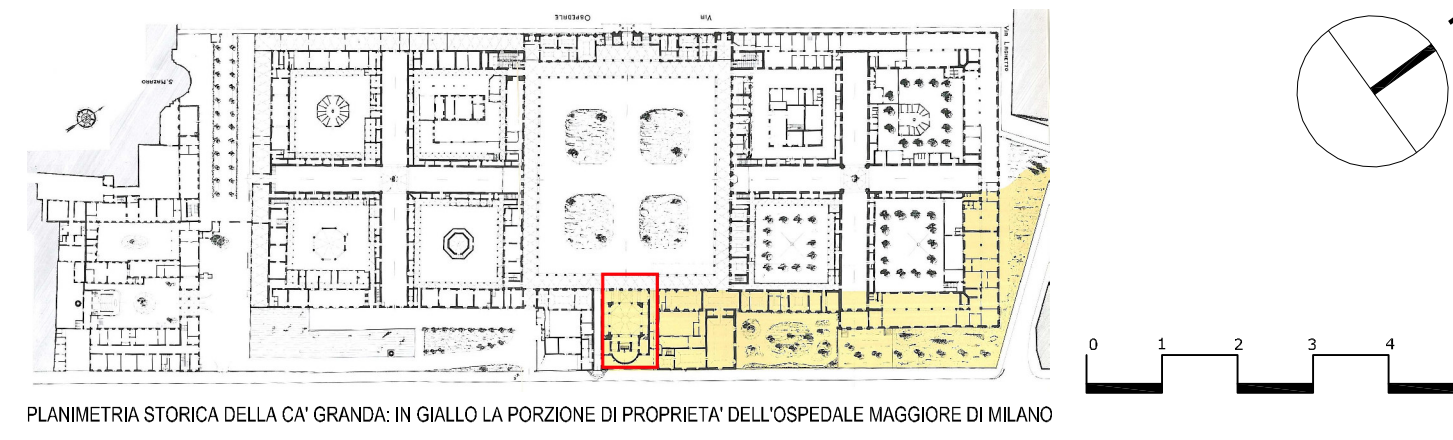
PLANIMETRIA STORICA DELLA CA' GRANDA. IN GIALLO LA PORZIONE DI PROPRIETA' DELL'OSPEDALE MAGGIORE DI MILANO